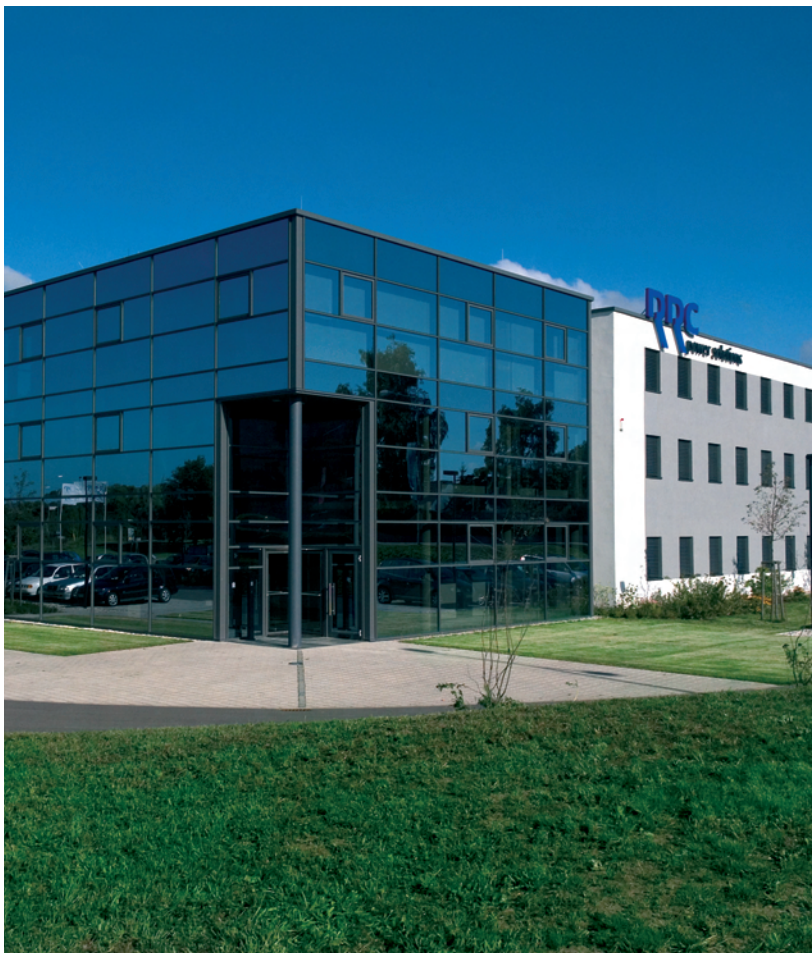
RRC power solutions GmbH, Technologiepark 1, D-66424 Homburg